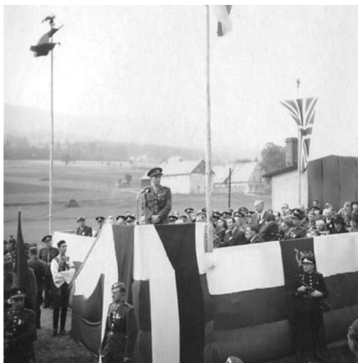
Obr. 5. Divisní generál Karel Klapálek při proslovu na čestné tribuně před odhalením pomníku.