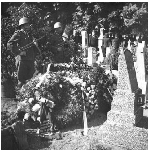
Obr. 4. Čestná stráž u hrobu padlých příslušníků finanční stráže na hřbitově ve Varnsdorfu 22. září 1945 odpoledne.