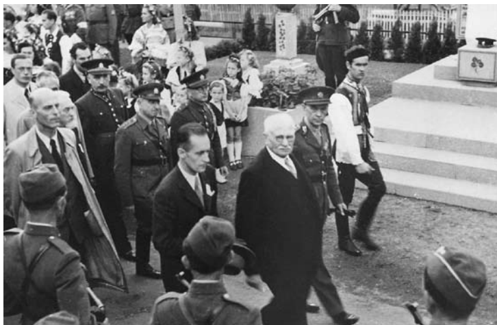
Obr. 6. Ministr financí Dr. Šrobár při přehlídce čestné roty finanční stráže.