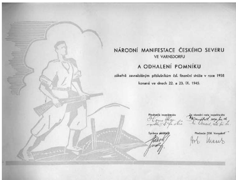
Obr. 2. Pozvánka pro významné hosty na Národní manifestaci českého severu spojenou s odhalením pomníku padlým hraničářům v Dolním Podluží.